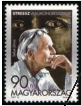
1997年ハンガリー発行「世界ストレス学会記念切手」

ストレスという言葉は、1935年ハンス・セリエによって医学の分野で初めて使われ、私たち(身体と心)に加わる外からの刺激をすべてストレス、それによって生体に反応がおこることをストレス反応と提唱されました。